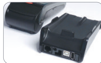
Basis mit Kommunikationsmodul