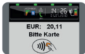
Farbdisplay mit Statusleiste

Die Applikationssoftware unterstützt alle im deutschen Markt etablierten Zahlverfahren und kann auch für den Einsatz im Ausland konfiguriert werden. Die Erweiterung um Zusatzapplikationen beispielsweise für Loyalty-Anwendungen ist möglich. Das Remote-Download Konzept über IngEstate stellt eine einfache Wartung im Feld sicher.